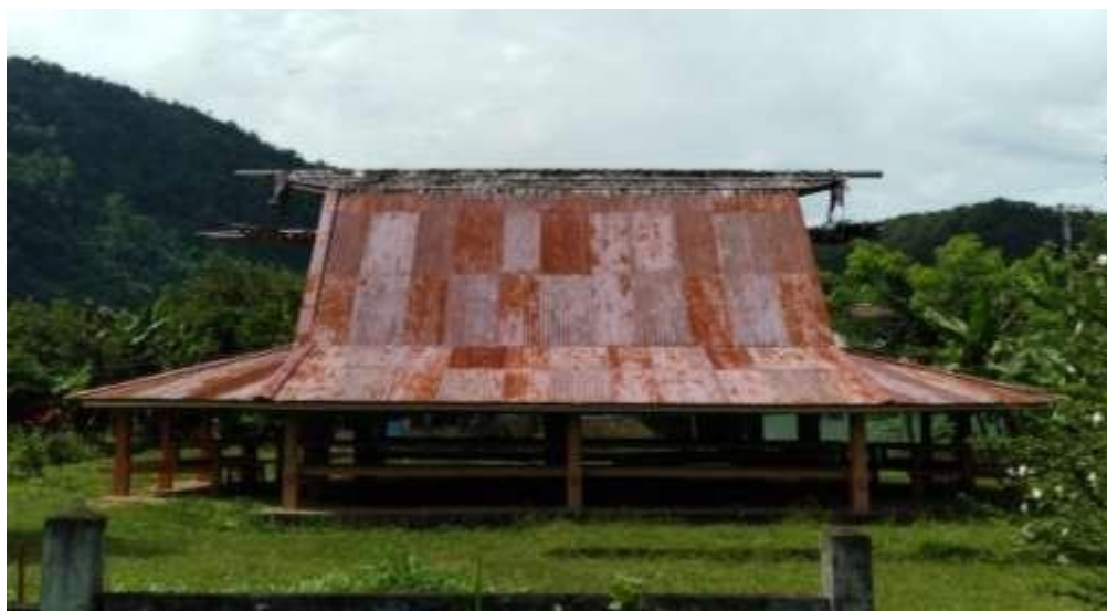
Foto 1. Rumah adat sasadu Desa Idamdehe Gamsungi