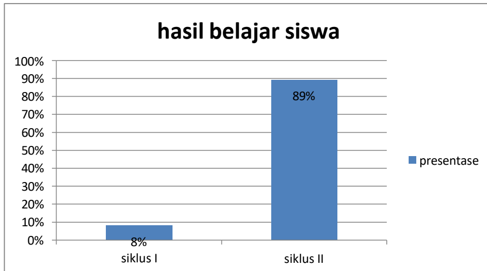
Gambar 3. Grafik Hasil Belajar Siswa Pada Siklus I Dan Siklus II

Pada siklus ini peneliti melakukan pertemuan dengan siswa sebanyak II dua kali tatap muka setelah proses belajar mengajar selesai peneliti membagikan lembar tes siklus II dengan jumlah soal 15 dalam bentuk pilihan ganda setelah siswa selesai mengisi lembar tes siswa mengembalikannya ke pada peneliti data hasil belajar siswa diperoleh setelah peneliti memeriksa hasil tes yang dikerjakan siswa hasil yang diperoleh tiap tiap siswa dilihat hasilnya dengan jumlah siswa sebanyak 36 siswa yang mengikuti tes dan yang tuntas sebanyak 32 siswa yang berhasil. Dari siklus II dengan skor perolehan 89%. Hal ini dikarenakan peneliti sudah mampu menciptakan suasana belajar dikelas lebih baik dan siswa sudah terbiasa dengan metode yang digunakan oleh peneliti. Peneliti sudah mampu memberikan siswa dorongan dan motifasi agar lebih giat lagi mengikuti proses belajar mengajar dikelas atau aktif didalam setiap tahapan pembelajaran sehingga di siklus II hasil belajar siswa sudah mencapai ketuntasan kkm.